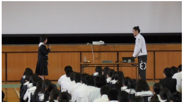
【 代表生徒の挨拶 】