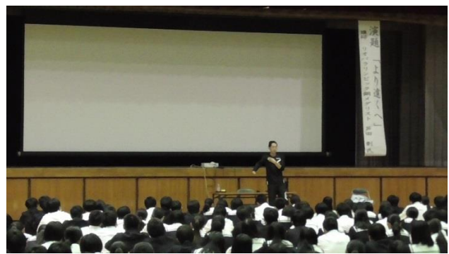
【 講演② 】