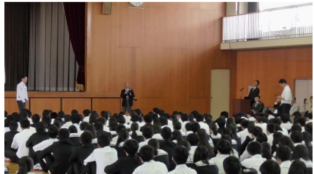
【 質疑応答① 】