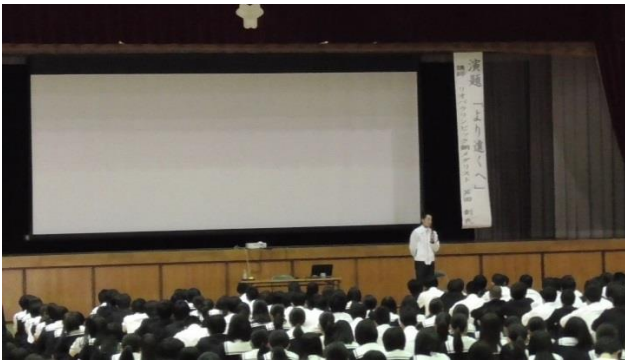
【 講演① 】