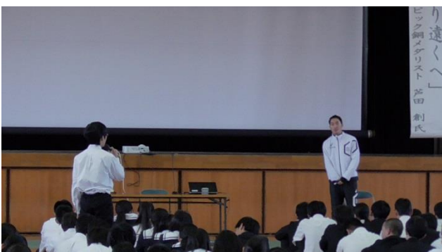
【 質疑応答② 】